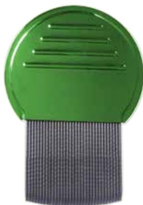
grzebień na wszy

Dobry grzebień do wyczesywania wszy można kupić w aptece. Ma on cienkie, bardzo gęste i kanciaste zęby, które się nie wyginają.