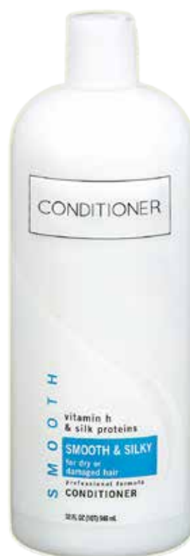
kremowa odżywka do włosów do sptukiwania, odżywka do wmasowania lub balsam