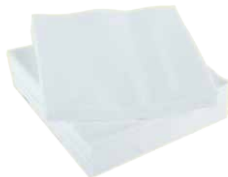
białe serwetki lub ręczniki papierowe